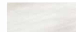
Sterling Silver Marble