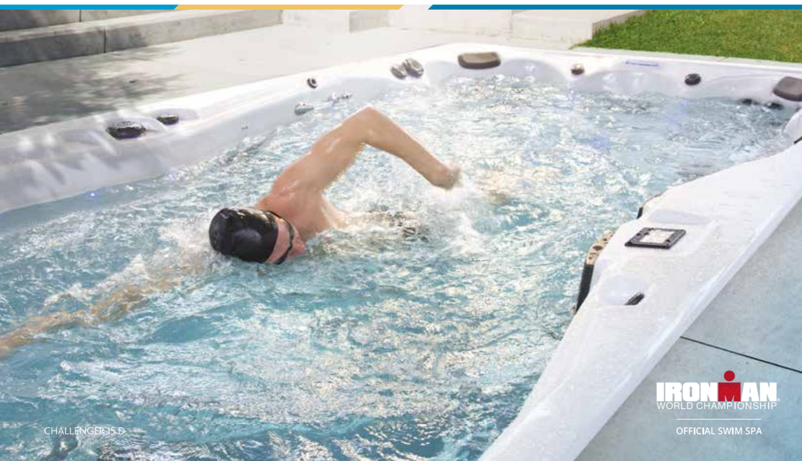
CHALLENGER 15 D