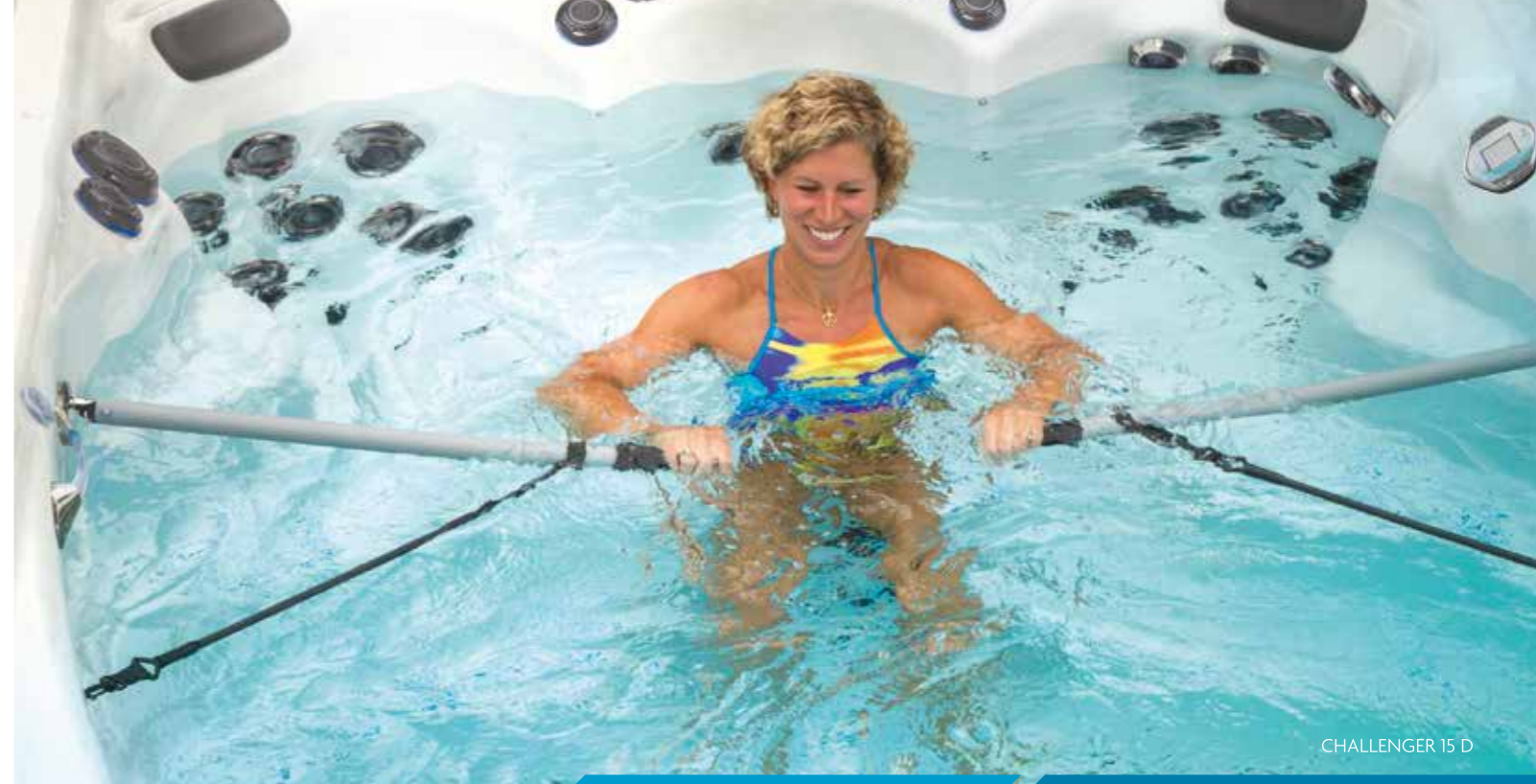
CHALLENGER 15 D